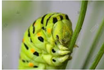
cabeza / head