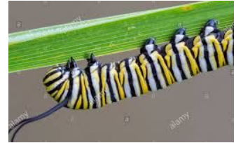
patas / feet