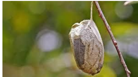
capullo / cocoon