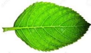
hoja / leaf