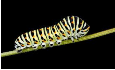
oruga / caterpillar