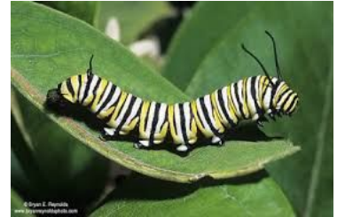
antenas / antennas