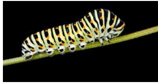
abdómen / abdomen