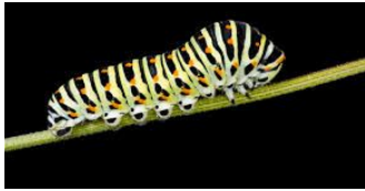
tórax / thorax